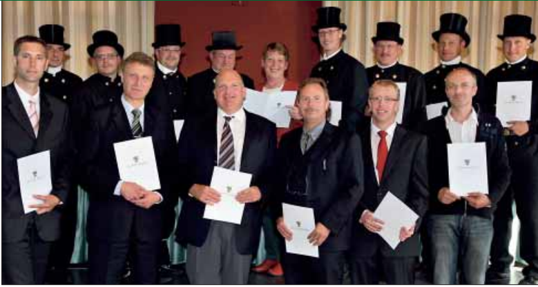
Aufnahme neuer Mitglieder am 16.06.2009