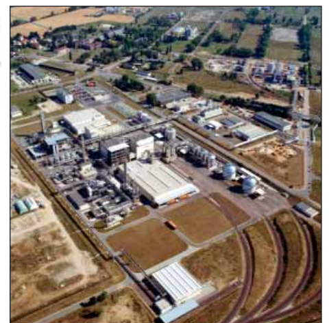
Der Standort Zeitz aus der Vogelperspektive

Die Umsetzung des Projektes liegt in den Händen von CeChemNet. Das Central European Chemical Network CeChemNet koordiniert als interdisziplinärer Verbund seit 2002 die Zusammenarbeit der sechs mitteldeutschen Chemiestandorte.