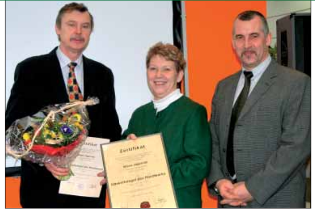
Umweltsiegelverleihung auf der diesjährigen Mitteldeutschen Handwerksmesse in Leipzig