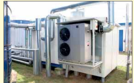
Die moderne Biogasanlage der Milk-Snack Produktions GmbH

Die Milk-Snack Produktions GmbH erbringt mit ihrem Umweltmanagementsystem nach DIN EN ISO 14001 einen sehr umfas-