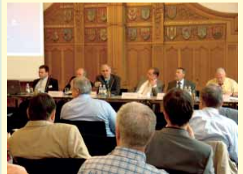
Fachkolloquium in der IHK Halle-Dessau

Unterstützt werden innovative abfallwirtschaftliche Maßnahmen zur stofflichen und energetischen Verwertung von Abfällen, die Förderung einer integrierten Produktpolitik und des produktintegrierten Umweltschutzes sowie die Entwicklung neuer Produktkonzeptionen. Zu den Schwerpunkten gehören außerdem Deponieschließungsmaßnahmen.