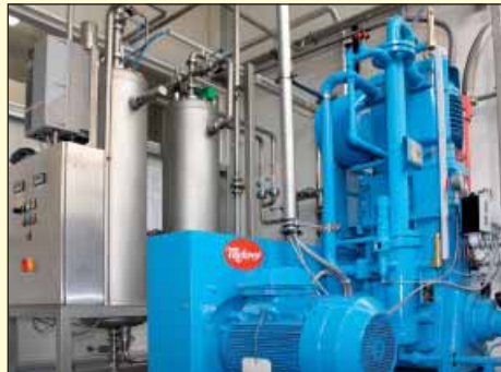
Die CO 2 -Rückgewinnungsanlage der Rotkäppchen Sektkellerei GmbH

So hat die Rotkäppchen Sektkellerei GmbH u.a. in eine Rückgewinnungsanlage für CO 2 aus dem Herstellungsprozess von Flaschengärsekten investiert. Damit kann das beim Transvasierverfahren anfallende CO 2 aufgefangen, mittels eines Kompressors verdichtet und im Kreislauf genutzt werden. Das Anfang 2009 realisierte Vor-