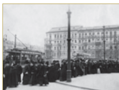
Demonstration für das allgemeine Frauenwahlrecht zum 1. Internationalen Frauentag am 19. März 1911 in Berlin

Am 19. März 1911 gingen mehr als eine Million Frauen in Dänemark und Deutschland, in Österreich-Ungarn und der Schweiz und in den USA auf die Straße. Ihre zentrale politische Forderung war das freie, geheime und gleiche Wahlrecht für Frauen. Clara Zetkin schrieb nach diesem ersten internationalen Frauentag: „Das war die wichtigste Demonstration für die Gleichberechtigung der Frau, die die Welt bis jetzt gesehen hat.“