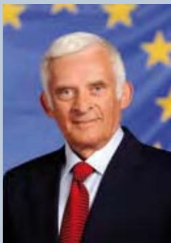
Jerzy Buzek, Präsident des Europäischen Parlaments