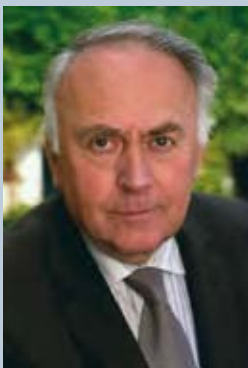
Prof. Dr. Wolfgang Böhmer, Ministerpräsident des Landes Sachsen-Anhalt

Vor 60 Jahren, am 09. Mai 1950, legte die Erklärung des französischen Außenministers Robert Schuman den Grundstein für die Entwicklung der Europäischen Union. Über bedeutsame Meilensteine wie die Verträge von Maastricht, Amsterdam und Nizza wurde nun eine neue Phase der europäischen Integration eingeleitet: Am 1. Dezember 2009 ist der Vertrag von Lissabon in Kraft getreten, durch den auch die Bürgerinnen und Bürger Sachsens-Anhalts neue Möglichkeiten erhalten, an europäischer Politik mitzuwirken. Folglich gilt es, über diese neuen Mitwirkungsrechte in der EU zu informieren und die Bedingungen dafür zu schaffen, sie effektiv nutzen zu können. Diesem Ziel widmet sich auch die diesjährige Europawoche in Sachsen-Anhalt.